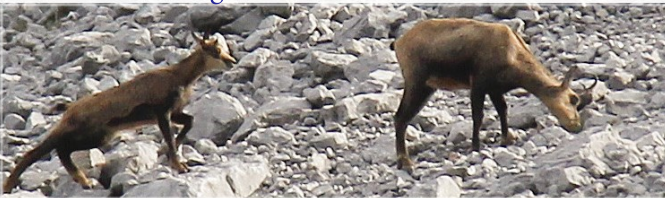
Max. Teilnehmerzahl: 15 Personen

Wandern geht immer mit WANDELN einher. Auf einer Pilger- oder Wallfahrt ist nicht das anvisierte Heiligtum allein, sondern auch der WEG dorthin Ziel der Reise. Die Begegnungen, Erlebnisse und Entbehrungen auf diesem Weg bewirken einen inneren WANDEL (Katharsis) und tragen so maßgeblich zum seelischen WACHSTUM bei, um – einmal im Ziel angekommen – mit der erforderlichen inneren WÜRDE ausgestattet zu sein.